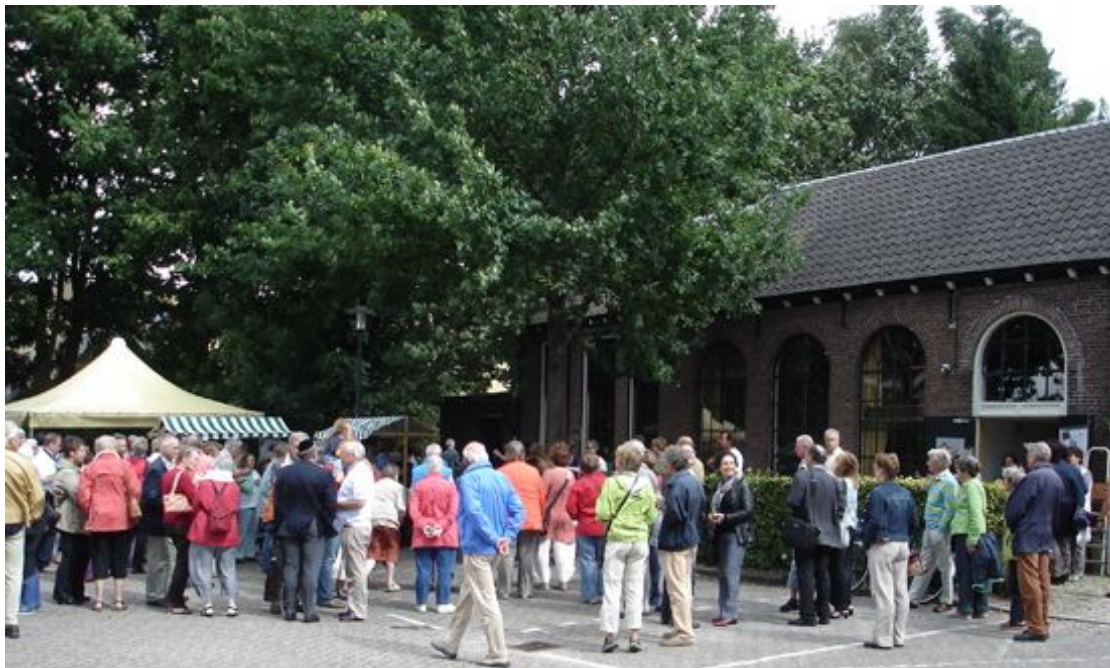
overweldigende belangstelling uit heel Nederland tijdens TV opnamen voor het programma BankGiro Loterij Restauratie 13 augustus 2008